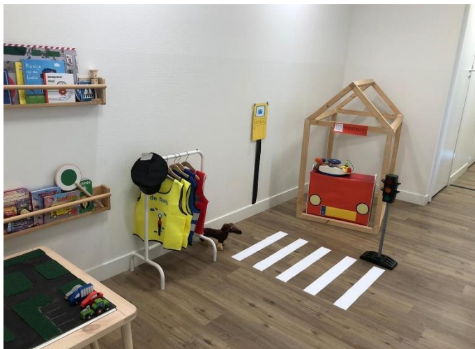
Sfeerimpressie van de themaweken Verkeer bij Klein & Wijs