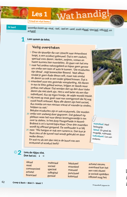
Leerwerkboek Basis Nieuw Nederlands Junior Lezen van groep 6

instructie en doelen en vaardigheden ter oefening in de context. Dit is een verklaring voor de opkomst van de schoolvakken. Toch merken we in het onderwijs dat de talige vakken als losse vakken niet dekkend zijn voor ons aanbod. In de verdeling binnen de schoolvakken is er gezocht naar een manier om taal in leerprocessen op te nemen. Dit is niet passend, omdat er naast deze leerprocessen ook ontwikkelprocessen zijn. Dit zorgt ervoor dat we moeten zoeken naar een tussenweg.